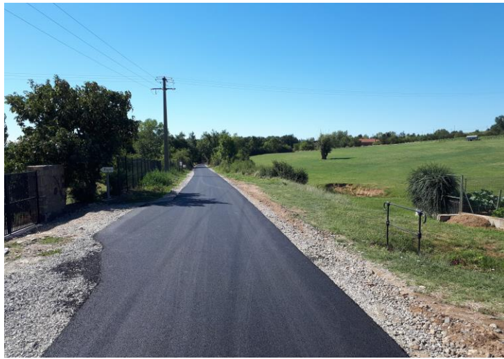
Via Fluvia – Vissenty Vernosc