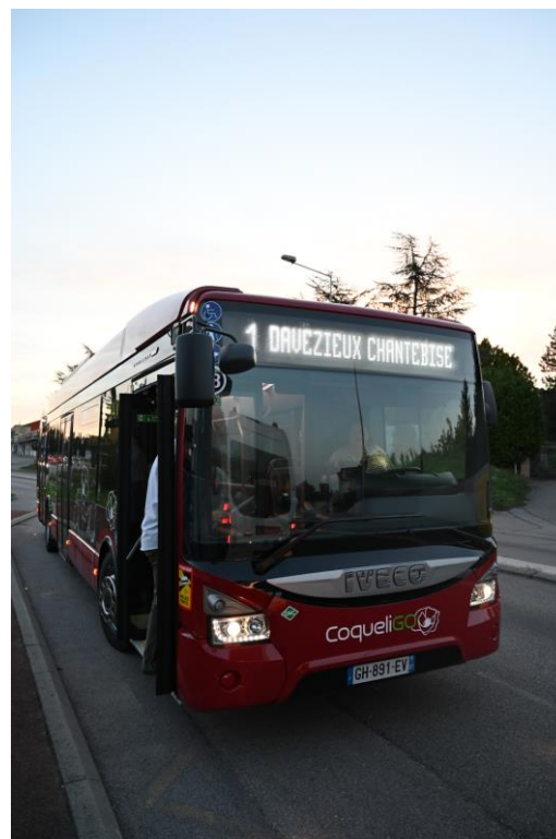
Construction du dépôt bus