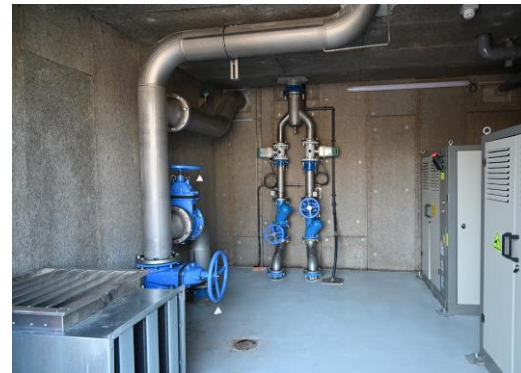
STEP Limony Serrières